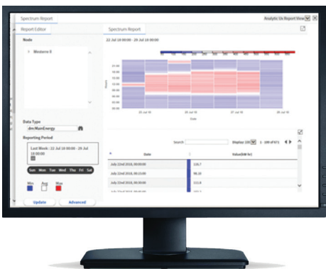
Informe de espectro